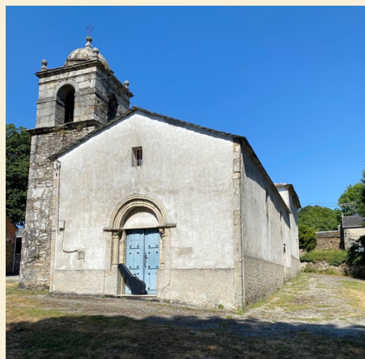
Ermita de Valonga

Al repertori trobem re-visitacions de temes antics: "Poble Sec" i "Rabassada", de La Nit (2012); "Tanguillo Bipolar", de Ombra de Lúa(2020). La resta son composicions post-pandèmia. "La roda i la gàbia" i "Portes Tancades" son part d'una fantasia en torn al funcionament de la roda del hámster. "8 anys", "Bifurcacions", "Reinici", "Reconsideració" i "Ni un pas enrere" son peces nascudes de improvisacions a l'ermita de Santa Maria de Valonga (Lugo).